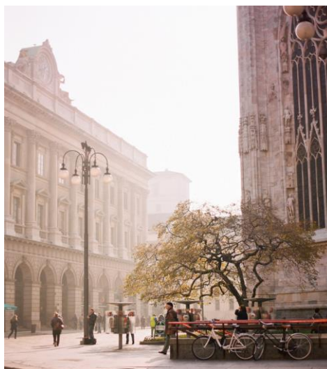
L'autunno a Milano!

Il tuo aiuto risolverà I problemi di cartilagine, lesioni articolari e di artrosi?