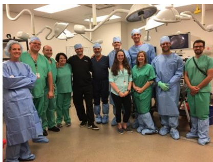
Il gruppo in Ohio