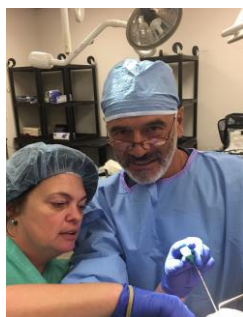
Doc in azione