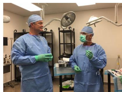
...ed ecco fatto!